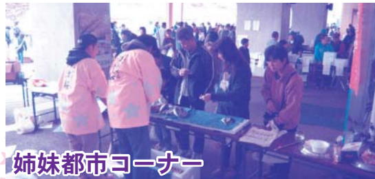
姉妹都市コーナー

今年もお茶席が2席設けられました。ひとつのお茶席では白馬高校の皆さんがお手前を披露しました。