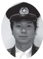
白馬村消防団 第3分団 白馬村消防団を代表し大北地区のポン

プ操法大会また、県大会では数々の優秀な成績を納め、本村消防団の士気高揚、消防意識の向上に大きく貢献しました。本年千曲市にて開催された県大会では、小型ポンプの部で準優勝の成績を収めています。