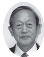
白馬砂防姫川源流の里フェスティバル実行委員会 平成7年以来、河川浄化や環境保護、治水事業の役割を提唱するイベントとして実行委員会が発足。毎年8月下旬の開催日では盛りだくさんの内容で治水の必要性や水環境保護をアピールして河川の保全意識向上へ寄与されました。

平成9年10月より教育委員を2期8年務められ、後半の4年半では教育委員長職務代理も努められ本村の教育振興に寄与されました。