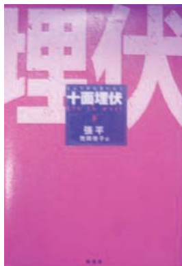
張 平 分類923ジ

凶悪な受刑者の口から繰り出される 中国全土を震撼させた数々の重大な未 解決事件の『詳細』。刑務所捜査官は 事件解決に向け動き出すが…。中国三 大文学賞受賞作品。小説。