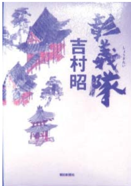
吉村 昭 分類ヨ