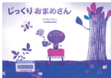
たちもとみちこ 分類Eタ

コーヒー村の じっくりおまめさん は なににことにも じっくり じっく り じっくり…。だから だいききな にっこりおまめさんに なかなか想 いを伝えられないのでした…。