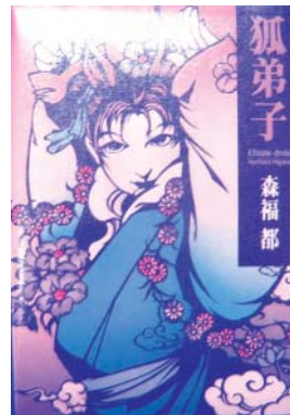
森福 都 分類Fモ

狐になりたかった少年の理由(わけ) とは!? 化身、幽鬼、ト点、超美人…。 中国唐代奇譚小説集全七編。