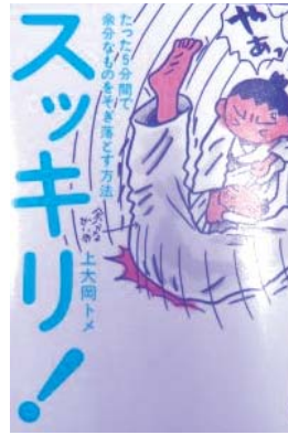
上大岡トメ 分類159カ

「キッパリ」第二弾。 心もカラダも生活もせい肉をたった 5分でそぎ落とす60の方法。