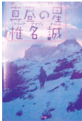
椎名 誠 分類915シ

今日もシーナは旅の空……。辿り着 いた最果ての地には、いつも真昼の星 が輝いていた。パタゴニア、アマゾン、 チベット紀行。