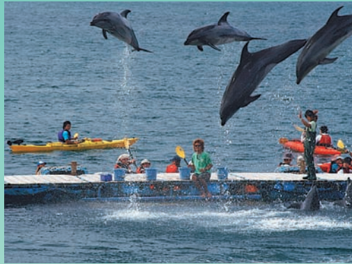
シーカヤックでイルカのジャンプを満喫！

6月2日、太地町の森浦湾で先月から串本、那智勝浦、古座川、太地の4町で開かれている「南紀わかやまアウトドアフェスティバル」のイベントの一つとして「シーカヤックでイルカのジャンプを見よう」が開催され、関西方面から約30人がシーカヤックに乗って海上散歩を楽しみました。森浦湾を探索して、イルカとふれあいができる施設「ドルフィンベース」へ立ち寄り豪快なイルカのジャンプを海上から間近に見ることができ、皆さん楽しんでいました。