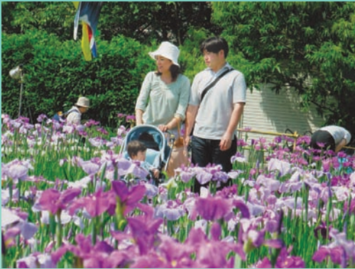
町の花・花菖蒲の季節

昭和50年に指定された河津町の花が花菖蒲です。「かわづ花菖蒲園」では、約130種、25,000株の菖蒲が植えられています。見ごろを迎えた園では、たくさんの家族連れや観光客が散策を楽しんでいます。白や紫の花に囲まれていると、園内をめぐる歩みも自然とゆっくりになります。今年は夜間ライトアップも行われ、昼間とは違った妖艶な雰囲気を楽しめました。