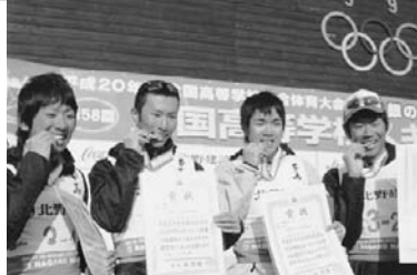
メダルを味わう男子リレーチーム