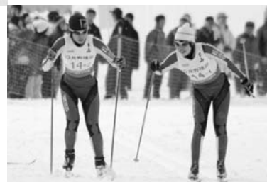
女子クロスカントリーリレー