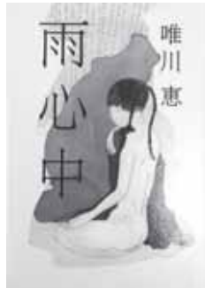
唯川 恵 分類 Fユ