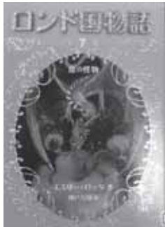
エミリー・ロッダ 分類 933ロ

オルゴールに封じられた別世界への扉が開いた…。怖くて不思議な国の冒険物語。(1～7巻)