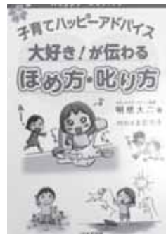
明橋 大二 分類 379ア