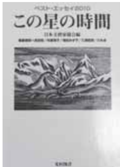
日本文藝家協会(編) 分類 914コ