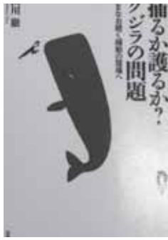
山川 徹 分類 664ヤ