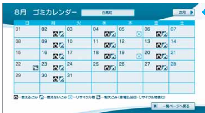
(ケーブルテレビ白馬データ放送の画面イメージ)