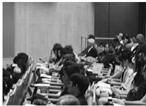
▲来賓の皆様からの祝辞を熱心に聴く