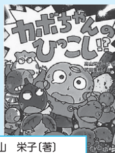
高山 栄子(著) 分類 913 タ

カボちゃんのおこし!! いちねんいちくみのおともだ ちと、もうあえなくなるなん て、こらえる……。