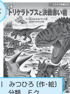
黒川 みつひろ(作・絵) 分類 Eク

恐竜トリケラトプスと 決戦赤い岩 なかまを助けるため、ゆうか んなトリケラトプスは、立ち 上がる! ティラノサウルスに 勝てるのか?