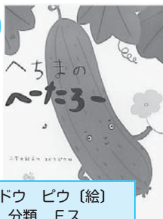
スドウ ピウ(絵) 分類 Eス

へちまのへた=3= へーたろーはにんげんのおん なのこにきゅうりとまちがえ られて、大ショック。そこで へーたろーは……?