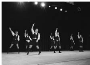
▲実行委員会によるダンス