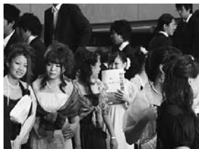
▲久しぶりの旧友との再会に喜ぶ