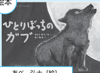
あべ 弘士(絵) 分類 Eア

ひとりぼっちのガブ 「あらしよるに」の主人公、 おおかみのガブがちいさかつ たころのおなほし。