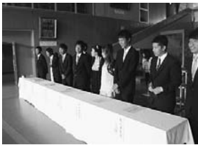
▲緊張の面持ちで受付に臨む

式典の後には、新成人の有志による実行委員会が計画した記念行事を行いました。この日のために練習した実行委員会7名によるダンスや白馬中学校で作成したVTRを披露。新成人主張という企画ではそれぞれの近況や想いを告白。その後実行委員会で準備をしたビンゴ大会を楽しみました。