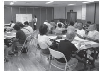
説明会では、知らぬ間に体に付いてなかなか落とせない脂肪1kgの模型や、脂肪肝・尿酸結晶の写真などもご覧いただきました。