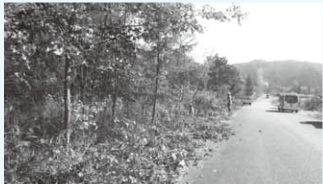
▲ 10月30日白馬建設業組合員による草刈