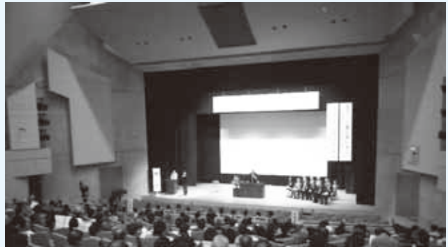
▲ 11月9日シンポジウム

50年目の節目として11月9日には土砂災害の教訓・継承のためのシンポジウムがウイング21で開催され、約300人の聴衆が訪れました。翌11月10日には松川左岸で100本の桜の植樹を実施し、約80名の参加者にご協力を頂きました。植樹に先立ち10月30日には地域貢献ボランティアとして白馬建設業組合員、約40名により草刈を実施して頂きました。