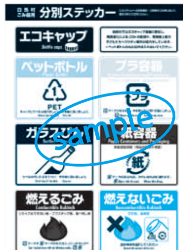
白馬村・白馬観光局