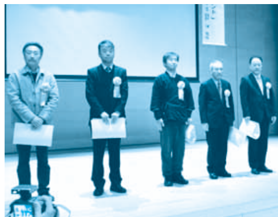
【大北地区の受賞団体の皆さん】