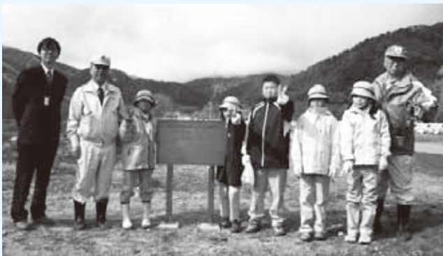
▲ 11月10日桜の植樹 記念プレートの前にて (左より松本砂防事務所長、白馬村長、白馬南小みどりの少年団、小谷村長)