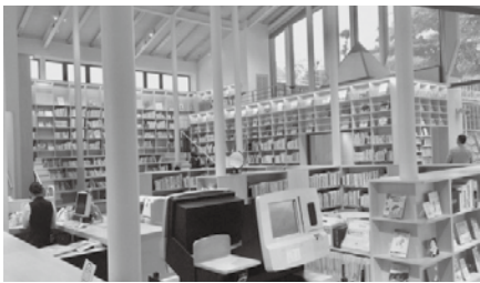
隣接することも図書館

「スタバがある図書館」として一躍その名を全国に轟かせた武雄市図書館だが、隣接されたことも図書館も素晴らしい。外には芝生、砂場、大型遊具。室内は本の山、秘密基地のような小部屋、飲食テナント（持ち込みOK）。子どもも大人もリラックスできる。体験から学ぶ、本から学ぶ、食から学ぶ。より豊かな親子の育ちを支援する「家」のような場所にしたという市長の思いが伝わる施設だった。