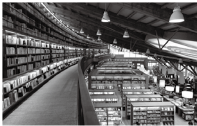
WiFiも使える広々とした館内

ツタヤが指定管理者となりスターバックスまで入る次世代図書館の先駆け。年中無休、Tカードで購入も蔵書貸出しも出来る。展示方法とスケールには圧倒された。注目すべきは市民アンケートに、新しい図書館が生活に変化をもたらす、街が変わったと答えていること。イベント頼みとは一線を画す新たな視点。本村の図書館計画ばかりでなく「まちづくり」に活かせる発想がそこにあった。