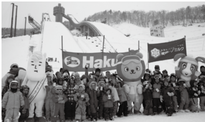
↑スキージャンプ子どもの日の様子。当日はゆるキャラも登場！

また『雪恋まつり』が開催されていました2月8日から16日の期間、リフトのナイター営業が行われました。これは平成4年にジャンプ競技場が建設されて以来、初の試みで、営業中は助走路部分がライトアップされたほか、道路や通路など会場内はペットボトルキャンドルで彩られました。