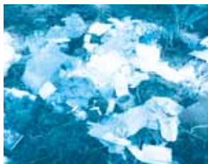
【山林に投棄された家庭ごみ】