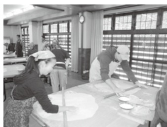
そば打ちは難しい! (第8回)