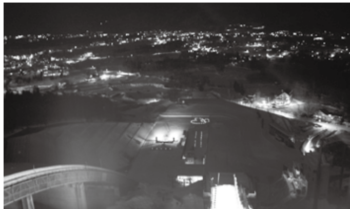
↑「雪恋まつり」中、ジャンプ台から白馬の夜景を望む