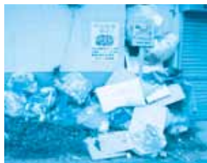
【地区集積場に出された粗大ごみ】