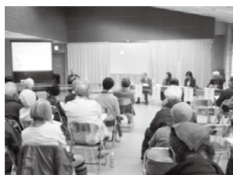
大糸線80年を振り返る (第6回)