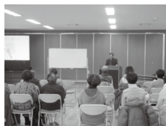
健康について学ぶ (第9回)