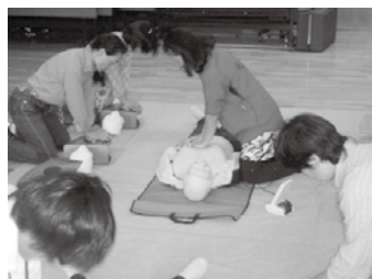
救命処置の基礎を学ぶ (第2回)