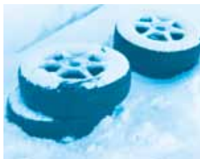
【道路脇に投棄されたタイヤ】