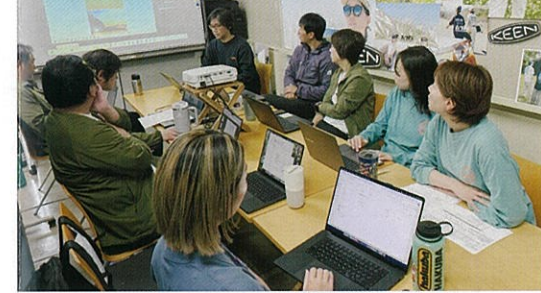
白馬村観光局事務局 営業時間 / 8:30-17:30 定休日 / 土日祝 TEL / 0261-72-7100

白馬村観光局は、白馬が誇る「雄大な自然景観と、それを体感できるアクティビティ」、環境に配慮したサステナブルな取り組み、そして受け継がれてきた地域文化など、地域固有の価値を「白馬ブランド」として国内外へ発信し、村の経済活性化につながる組織です。現在は3つの拠点を中心に、さまざまな事業を展開しています。 ■ 白馬村観光局事務局（白馬村役場 多目的研修施設2階） ブランディングやプロモーション、旅行商品の造成、地域事業者と連携した受入環境の整備、イベント企画、オリジナル商品の企画などを通じて、四季を通じた魅力ある観光地づくりを推進しています。 ■ 白馬村観光局インフォメーション（Snow Peak LAND STATION HAKUBA内） 国内外から訪れる観光客への案内業務を行っています。観光情報の提供に加え、宿泊施設やアクティビティの案内、各種チケットの販売など、白馬旅の出発点として来訪者をサポートしています。 ■ 白馬ノルウェービレッジ（白馬ジャンプ競技場前） コワーキングスペースやホールレンタルを通じた交流拠点づくりを進めるほか、白馬村のふるさと納税関連業務も運営しています。テレワークや地域交流、新たな事業創出を支える施設として、観光と地域をつなぐ役割を担っています。 観光だけでなく、地域の暮らしや未来づくりにも関わる存在として、白馬村観光局は日々活動を続けています。