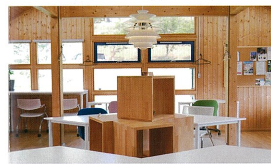
白馬ノルウェービレッジ 営業時間 / (平日) 9:00-17:00 (土日祝) 10:00-15:00 定休日 / 無休 TEL / 0261-85-2340