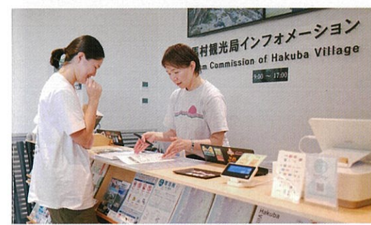
白馬村観光局インフォメーション 営業時間 / 9:00-17:00 定休日 / 無休 TEL / 0261-85-4210