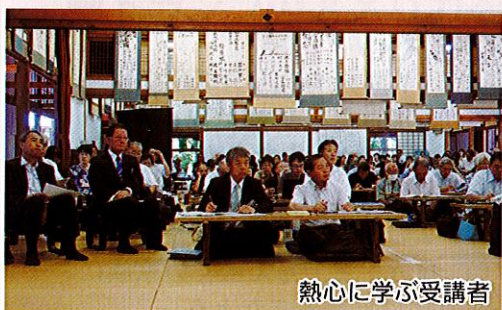
熱心に学ぶ受講者

北アルプスの麓、四季の山々の表情が湖面に映える木崎湖畔の丘の上に、わが国初めての夏期大学として信濃木崎夏期大学が開設されたのは、大正6年のことでした。令和8年となる本年も伝統を引き継ぎ、109回目の夏期大学を開講いたします。