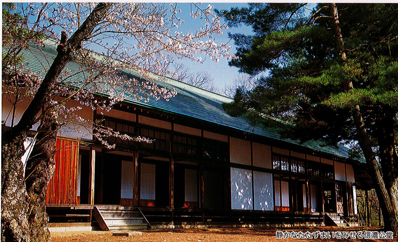
静かなたづまいをみせる信濃公堂