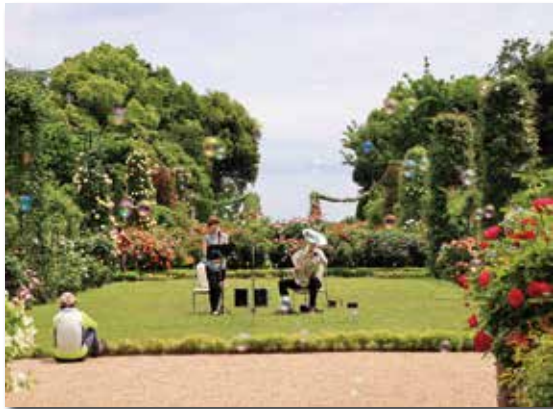
ローズガーデンでのミニコンサート