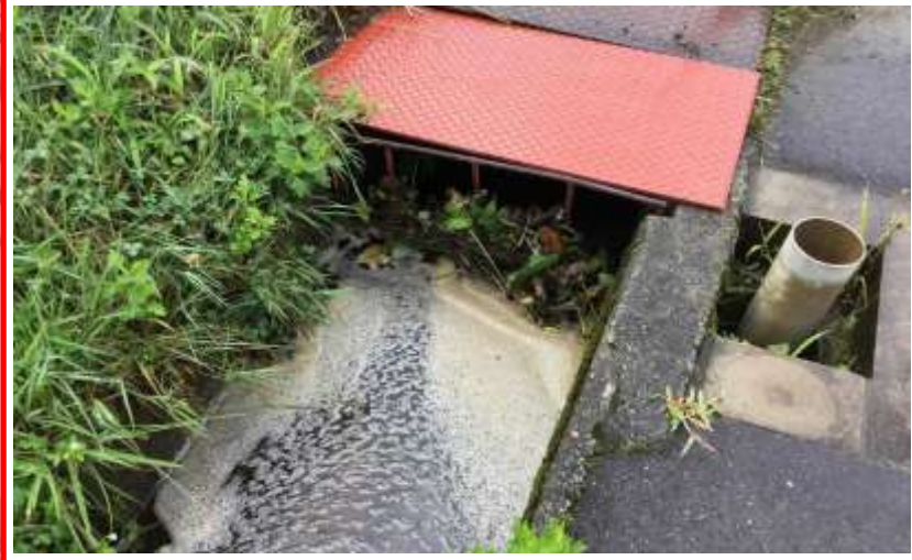
三日市場公営住宅水路・・・水路の清掃の要望