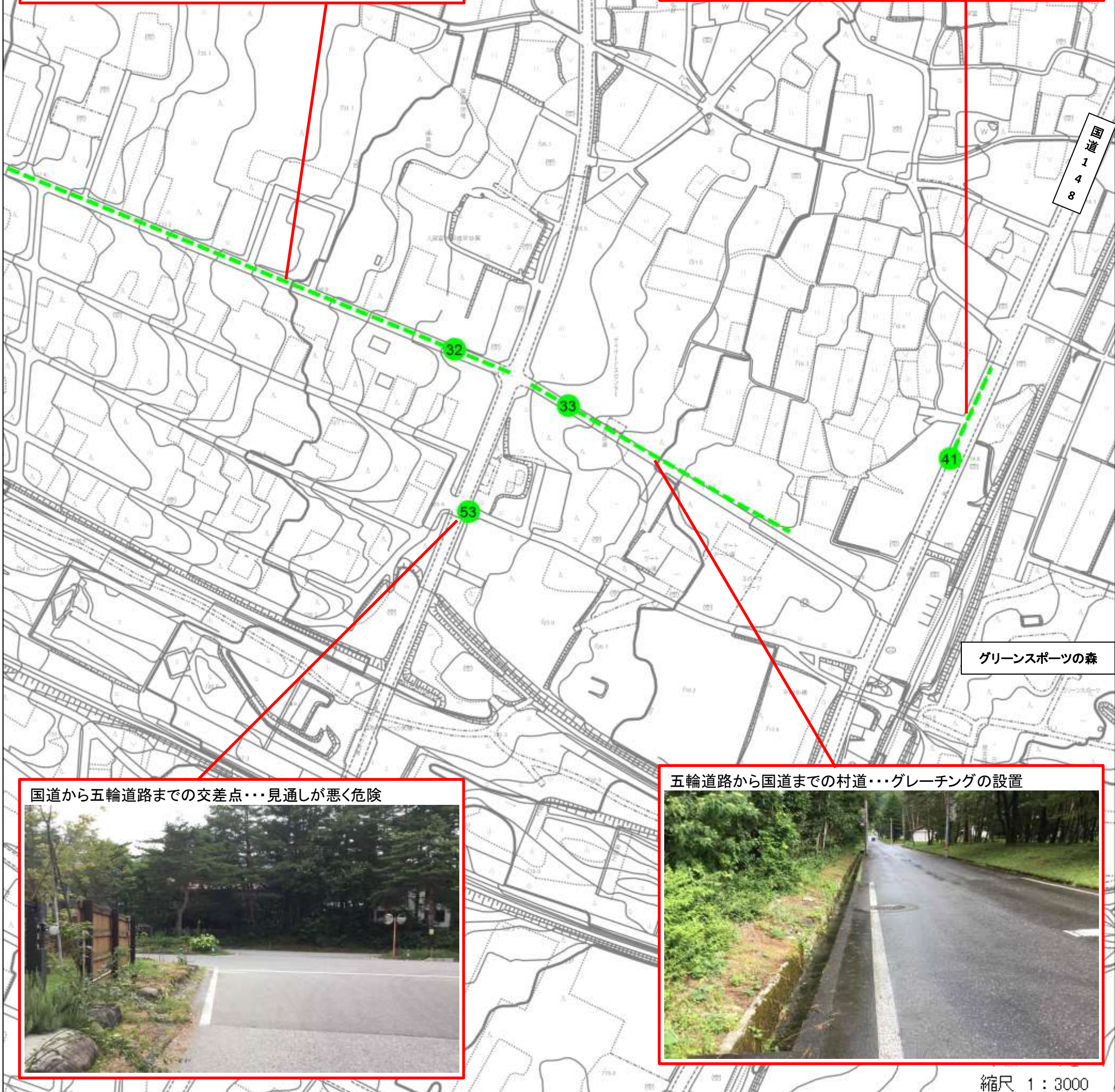
国道から五輪道路までの交差点…見通しが悪く危険