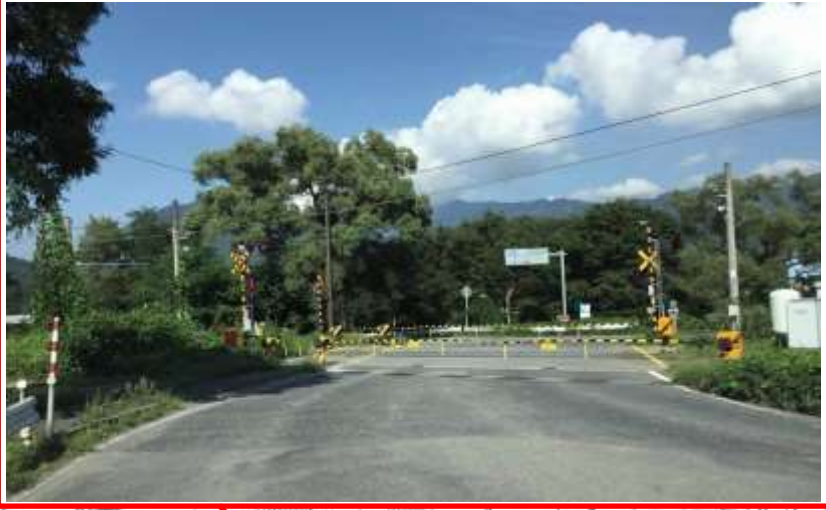
森上踏切・・・歩道もない為危険、安全対策の要望