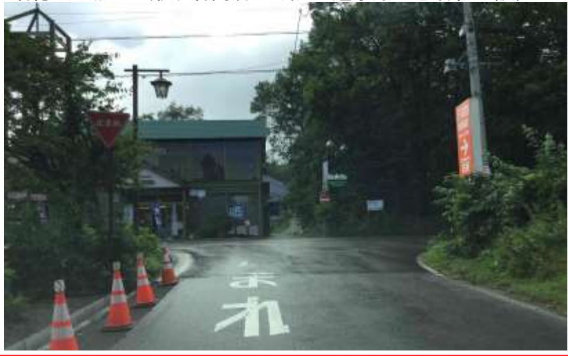
瑞穂交差点から鍛冶倉商店T字路・・・通学路注意看板の設置