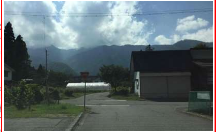
ゆきまる付近の十字路・・・見通しが悪く危険