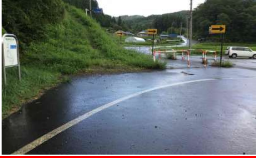
旧城嶺神社入口付近・・・Mount hatへのお客車両の駐停車