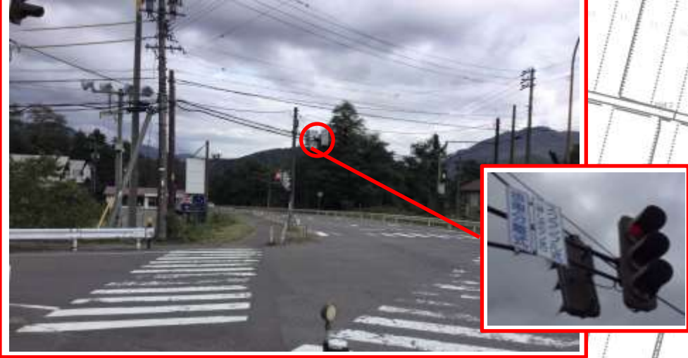
森上交差点・・・歩車分離標識の設置希望(設置済み)