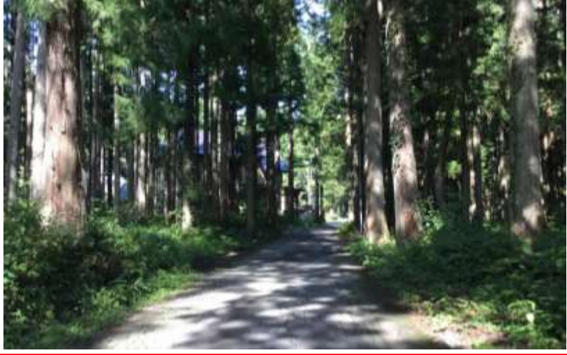
ワハラグラウンド北東林道・・・外灯の増設