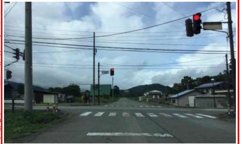
大出交差点・・・スクールゾーン等の看板設置