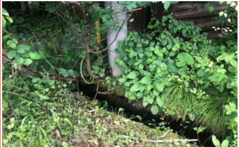
ワハラグラウンド西水路・・・水路の蓋設置