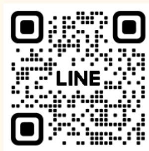
白馬村公式LINE 友だち登録

二次元コードを読み取り、「追加」ボタンをタップし、白馬村公式アカウントを友達登録してください。