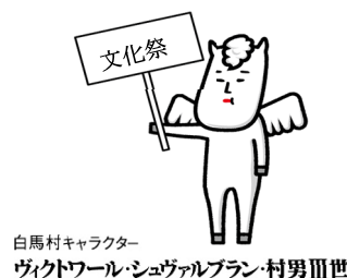
白馬村キャラクター ヴィクトワール・シュヴァルブラン・村男Ⅲ世

白馬村文化祭は今年で53回を迎えることとなりました。日頃、同好会やサークル、グループ等を通じて生涯学習として活動している皆様のご参加をお待ちしております。