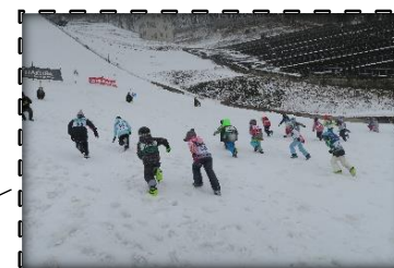
ジャンプ台登り競走