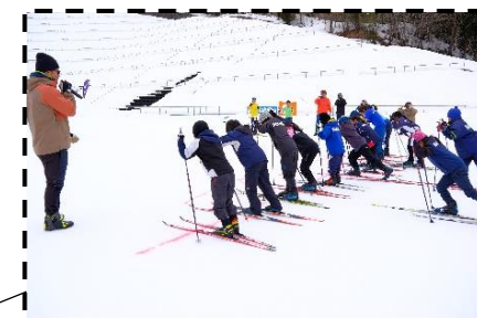
クロスカントリー体験 クロスカントリー大会 ※道具は無料レンタルできます （要事前予約）