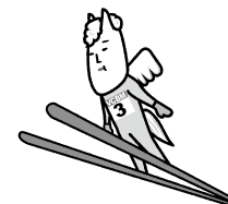
白馬村キャラクター ヴィクトワール・シュヴァルブラン・村男Ⅲ世