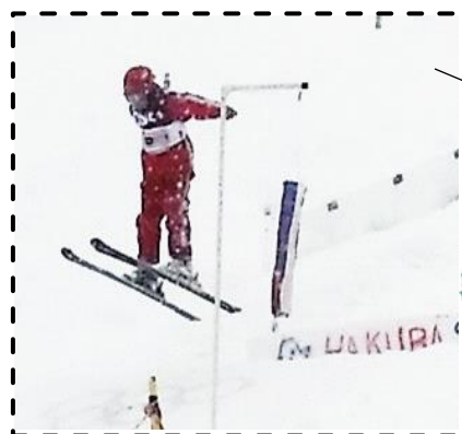
ミニジャンプ体験 ジャンプ大会