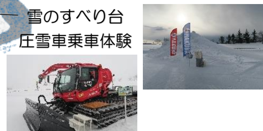
雪のすべり台 圧雪車乗車体験