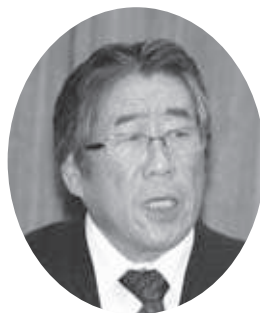
松本 喜美人 議員