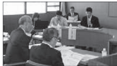
村長も参加しての研修会

当村の「総合戦略」は12月末までに策定する予定で、住民の皆さんの意見を反映させる目的で、10月5日と13日にウイング21でミニキャンプが開催されました。これからも多くの方々と、人口減少社会に向けて、ともに知恵を出し合っていくことが求められます。