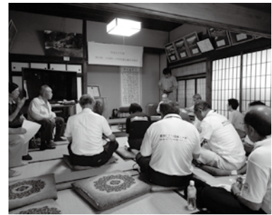
青鬼地区の歴史を学ぶ お善鬼の館

7月7日、三村(松川、小谷、白馬)議員交流会を白馬で開催しました。この交流会は、近隣の同じ人口、財政規模の中で村内の出来事や行政事業、議会運営等の情報交換です。 以前は、プレー中でも交流、対話がしやすいとの事でマレットゴルフが主流でしたが、最近は、各地域の動きや活動を知りたい、学びたいとの意見もありホットな現場で話を聞く視察研修会が多くなりました。 今回は、グリーンシーズンの目玉に育てたい、サイクリング観光に関連して、岩岳スキー場のマウンテンバイク、ゆり園事業。また伝統的建築物群保存事業を継続している青鬼地区を視察し、村の特産品、紫米栽培と棚田の維持活動なども併せて関係者から研修を受けました。 白馬観光開発(株)岩岳本部、青鬼地区の関係者のみなさん、丁寧なご説明有難うございました。