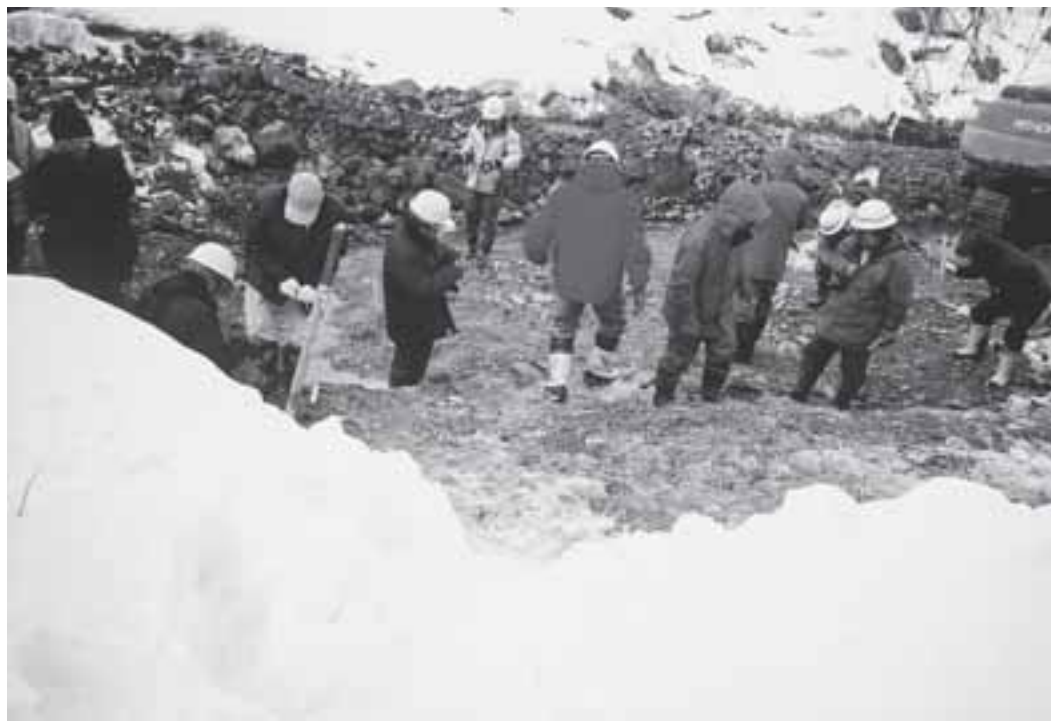
候補地に係る活断層等確認調査（2月1日）

ごみ処理問題は白馬だけの問題ではなく、広域連合内で計画が進められております。候補地決定は、客観的に3市村が同意の上で決めております。ごみ処理の広域化は効率化・経済負担軽減面からも進めるべきと考えています。