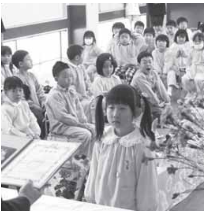
最後の南部保育園卒園式（3月25日）