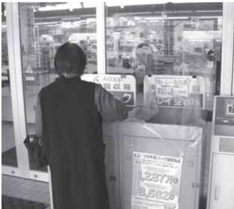
包装容器回収箱を設置してごみ減量化を支援する大型店舗

減少理由が住民の努力か、宿泊客の減少か、はつきりしないのもう少し推移を見守る必要があると思います。しかし、減量したか