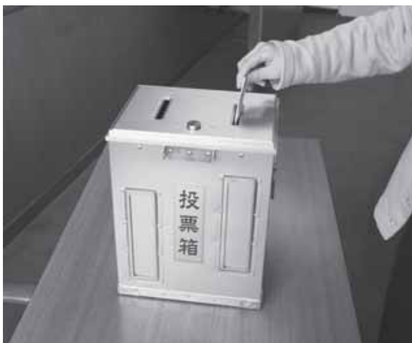
住民合意は投票で

確かに長引く不況で、観光を主産業とする村では、お客様の減少は宿泊業者に影響を及ぼしています。