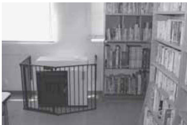
白馬村図書館に設置されたペレットストーブ

答 振興公社全体の運営費の中から貸付料としての収入が、岳の湯の燃料費の高騰による