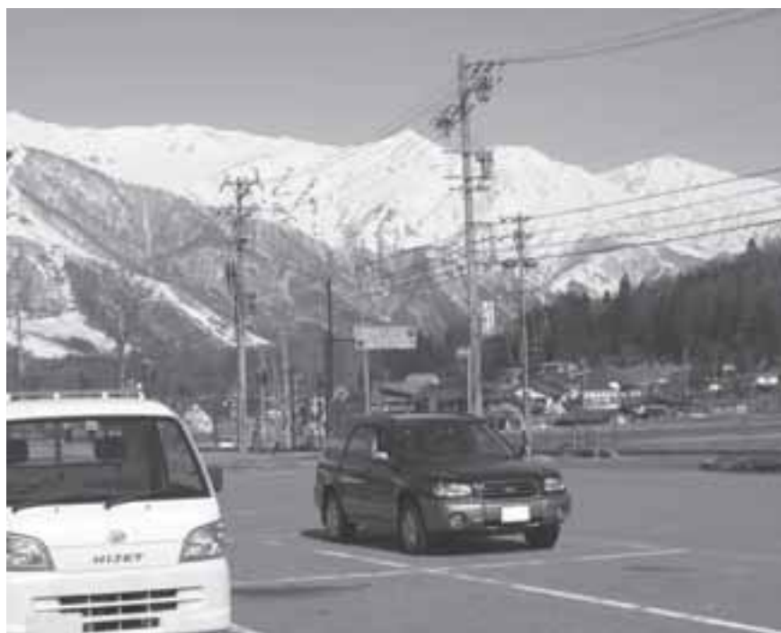
この景観 電線が無ければ…

官民一体となった検討委員会の立ち上げを、否定するものではありません。今だに選定経過を含め、