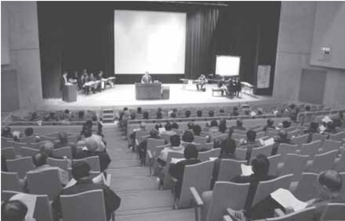
ごみ処理建設候補地に係る活断層等の確認調査結果説明会（3月17日 於ウイング21）