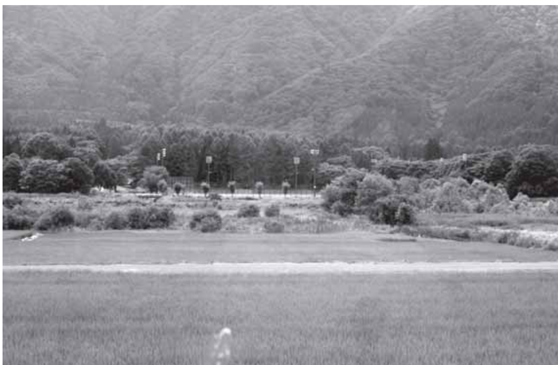
き始めた奈良井地区利活用計画 7月21日

村の経済への波及効果はあったと確信しています。今後、商工会等と連携して進めたいと思います。