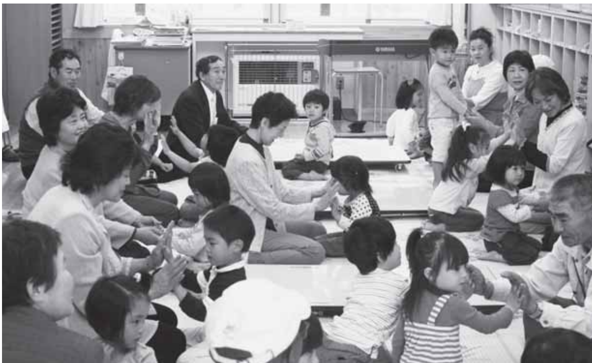
楽しい参観日 しろま保育園 6月1日