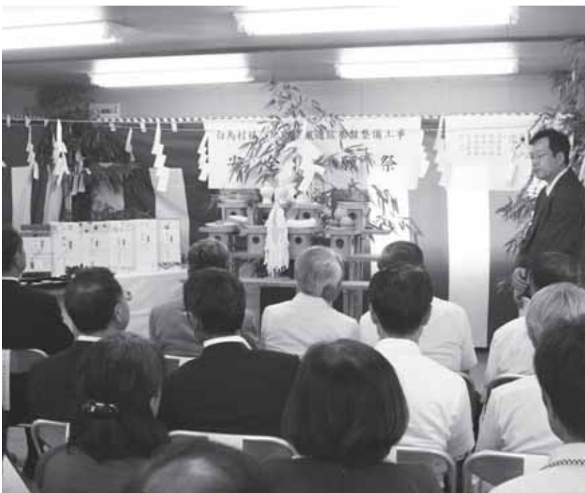
白馬村地域情報基盤整備工事安全祈願祭 7月23日

このあと第4次総合計画は後期に入りますが、基本構想・基本計画には、景観に関して詳細に謳われていますが、基本構想に基づいて、地域住民と開発業者の間の過去の