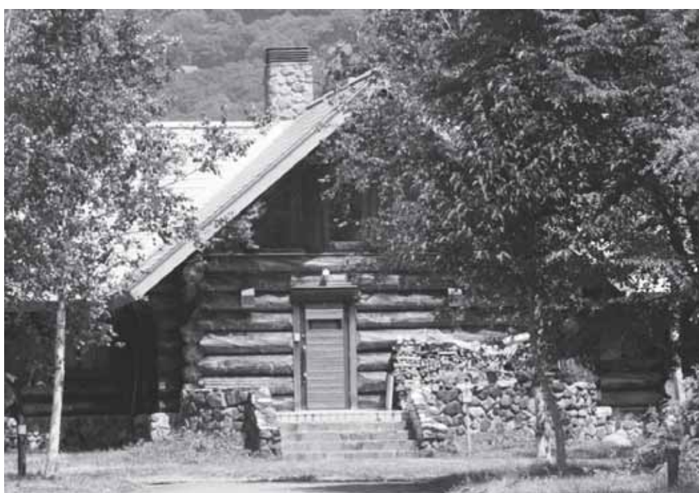
観光関係事業者研修所の建物 7月23日