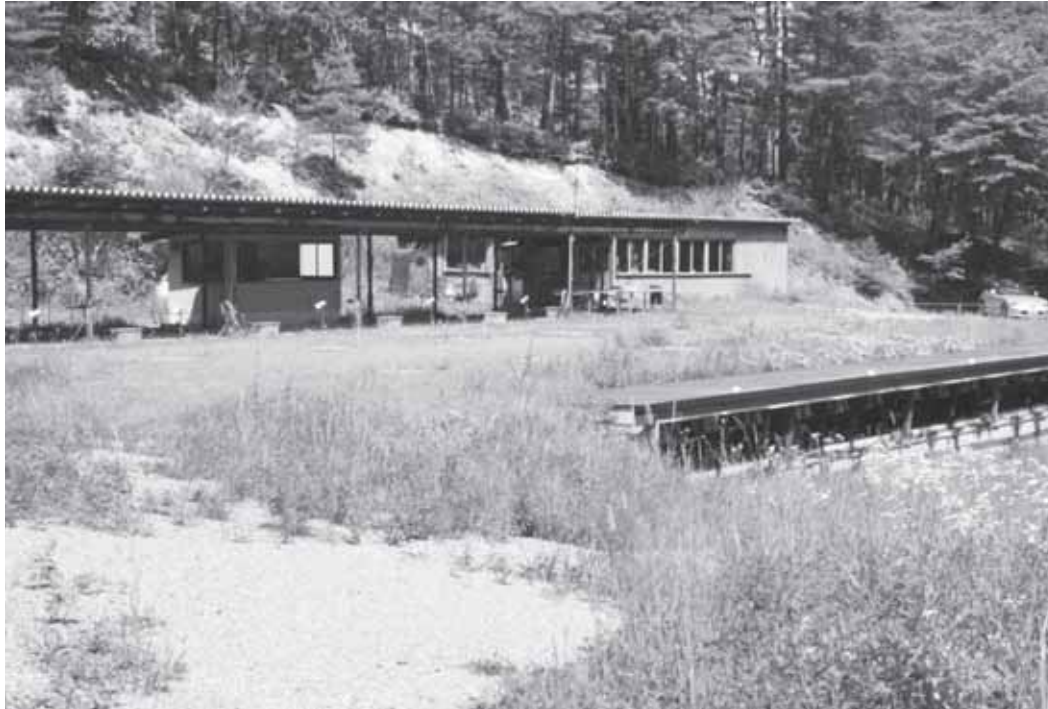
早期改修が望まれる大町射撃場 7月23日

村長 退職金は、村が一定の額を長野県町村総合事務組合へ支払い、そこで決定された額を本人に支払う制度です。もらわないということは制度上できませんが、退職時に改めて検討しますが、基本姿勢はもらわないことには変わりありません。