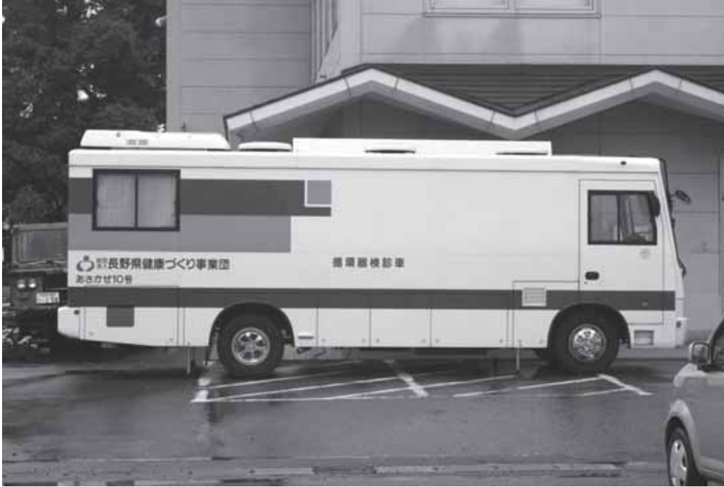
健康への一步は健診から 7月13日