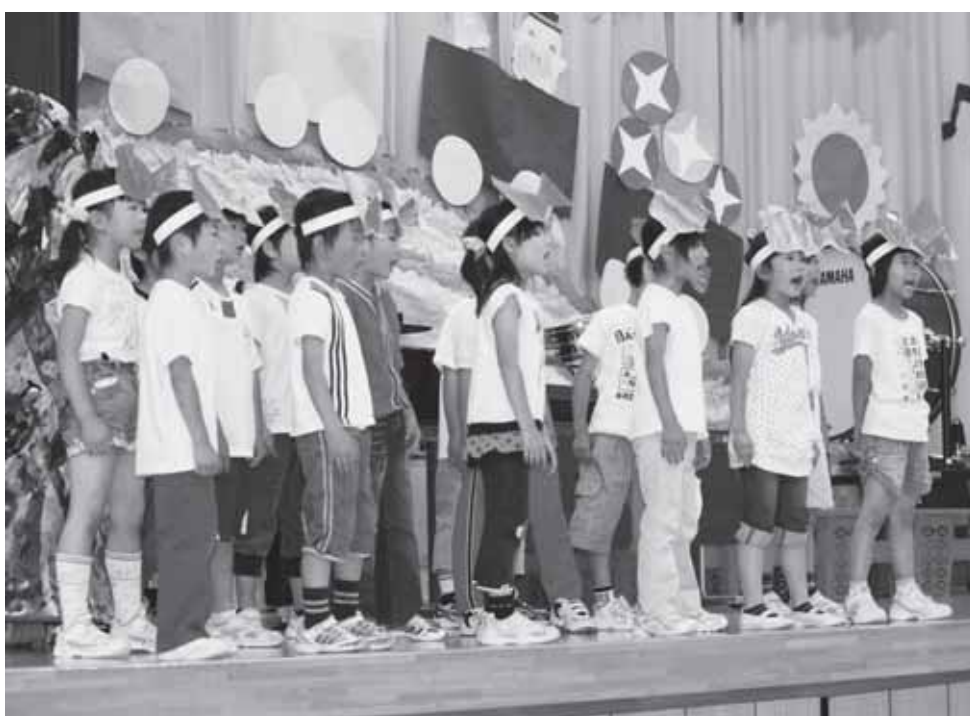
大きな声で 白馬南小音楽会 6月24日

関する事業が4件で109 万5千円。環境の保全及び 景観の維持再生の事業に、 7件で245万円、産業文 化を生かした国際交流推進 の事業に3件で、112万