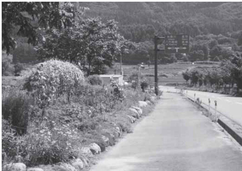
咲き誇る花 元気づくり支援金で植栽された花壇 7月23日

857件で472万3千円です。 ③滞納繰越分の徴収率が上がったため、課税の基が変わっているのではありません。 (倉科建設水道課長)