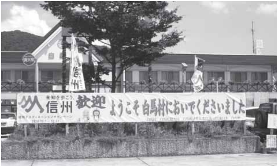
白马駅前 デスティネーション・キャンペーンの横断幕 7月21日

はほとんどなかった。で、局の果たす役割の調査分析を長野経済研究所に依頼し、その報告により理事会で検討のうえ、局長の公募と次長2名の3名体制で、事業執行責任者とした。派遣職員は、観光実務の難しさを体験し、民間感覚を養い、それを行政実務に生かすことを目的としたものです。