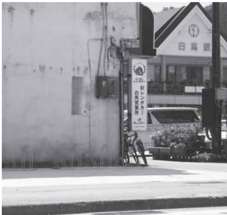
整備された駐輪場 7月23日

環境課では、減量化の取り組みをしています。ごみ減量作戦と名打ったキャンペーンを、新聞チラシ折り込みや広報紙への掲載を7回行いました。村民ホールにそれを拡大して展示し、村内の大型店、スーパーなどで同じキャンペーンを行っています。ごみ箱の分別ステッカーと、