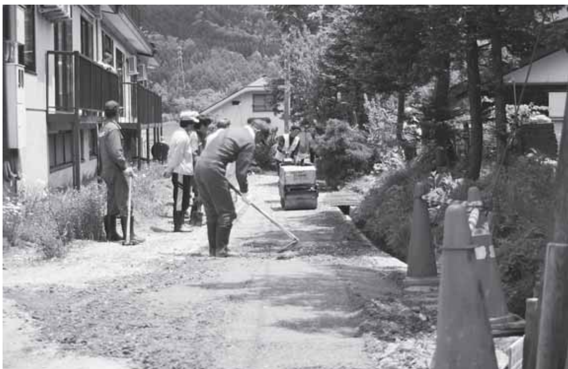
協働のむらづくり 5月30日