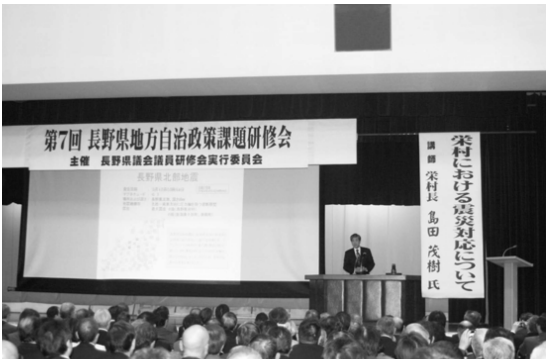
長野県地方自治政策課題研修会 (県庁 講堂) 1月17日