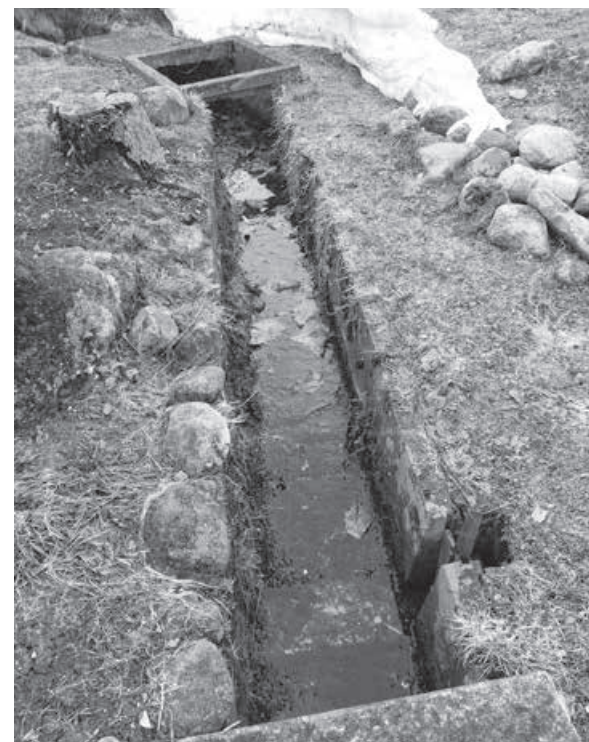
春先に水の来ない堰

答 一般的に河川法に基づかんがい用水は、秋以降に非かんがい期となることから、取水量を減少させることになっています。そのため、時期により通水