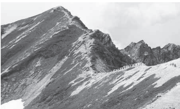
唐松岳を目指す登山者の列