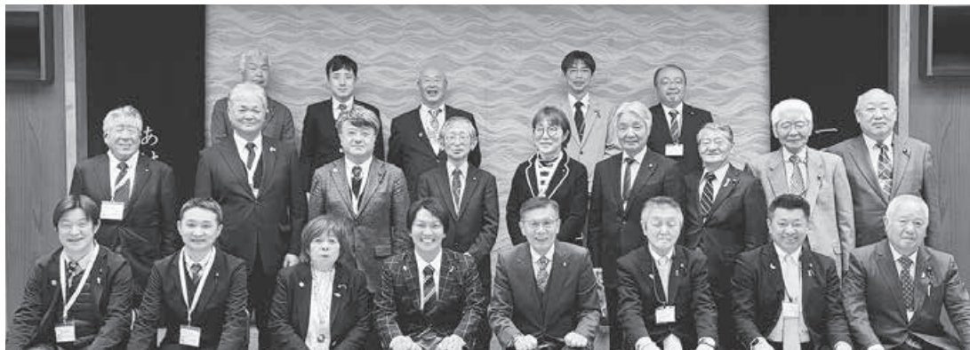
北ア横断トンネル構想（朝日・白馬ルート）実現を目指す朝日町議会との議員連絡協議会（4月8日）