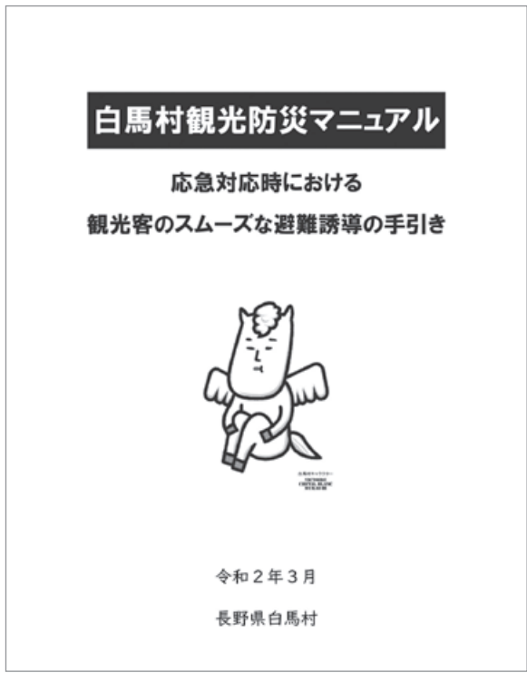
行政HPから参照できる観光防災マニュアル

答 現在は総務課を中心に防災業務を行っていますが、今後の災害対応力の強化に向け、他自治体の事例なども参考にしながら、必要な体制について研究していきます。