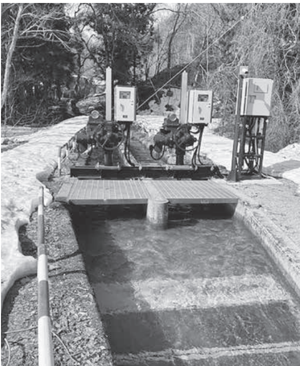
犬川用水電動ゲート完成 維持管理の軽減が図られる

答 企業版ふるさと納税につきましても、ご寄附いただく企業の意向を尊重することとしています。直ちに特定目的基金を創設する考えはございませんが、将来的な大規模更新需要の見通しや財政調整基金との関係について慎重に検証した上で、その必要性和有効性を見極めてまいります。