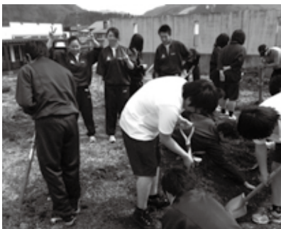
そば作り準備 プール横の空地を耕して

「地域コース」は塩の道、「自然コース」は植物などの自然観察、「野外コース」はそば作りを主なテーマとしており、生徒の活動を大切にしながら進めていきます。