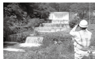
▲職員による既設点検の様子