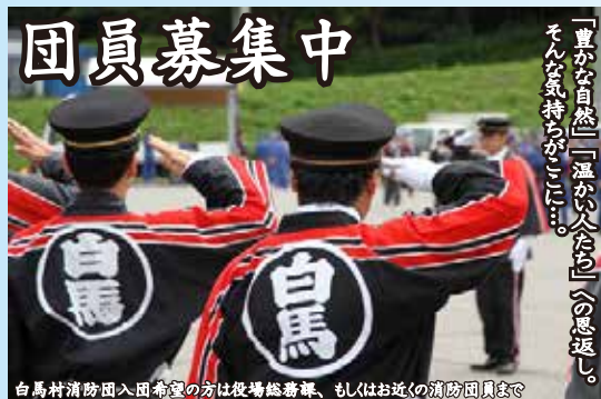
白馬村消防団入団希望の方は役場総務課、もしくはお近くの消防団員まで