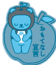
特製アルクマピンバッジ デザインは変更になることがあります