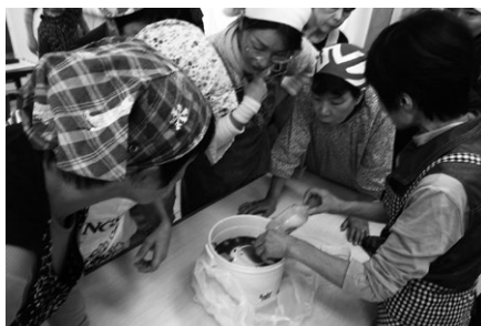
こしょう漬けを味見