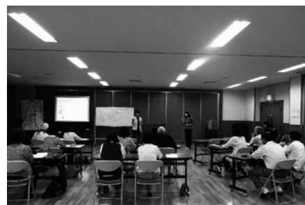
聴覚障がいについての講演