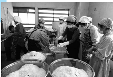
和気あいあい味噌作り