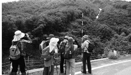
雪崩の跡を見に猿倉へ