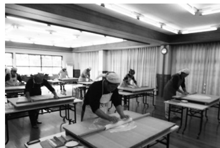
そば打ち名人への第一歩