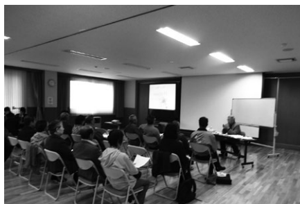
登山家ウェストンについて