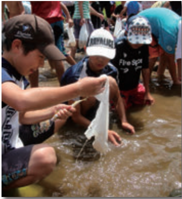
素早く動きまわる鮎を見事につかまえて喜ぶ子どもたち