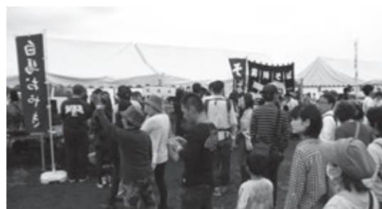
今年11月2日に太地町で開催された「くじら祭り」に出店。切久保そば打ち倶楽部や道の駅白馬、ハピアとともに祭りを盛り上げた。