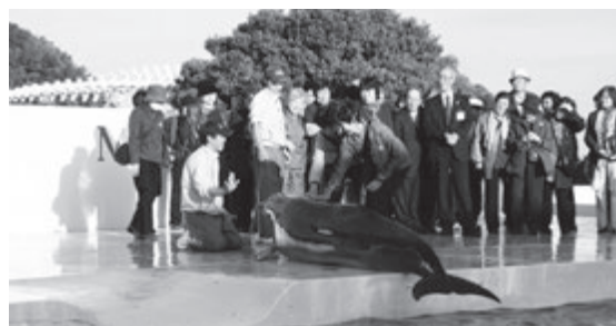
太地町のご厚意により参加者みなイルカにタッチ。