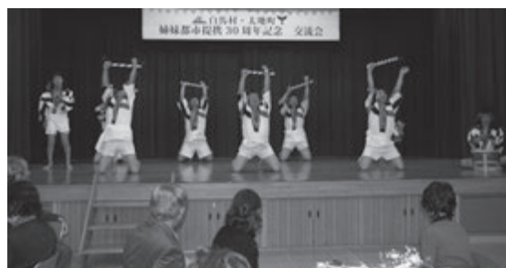
歓談の間には伝統芸能であるくじら踊りと獅子舞が披露された。