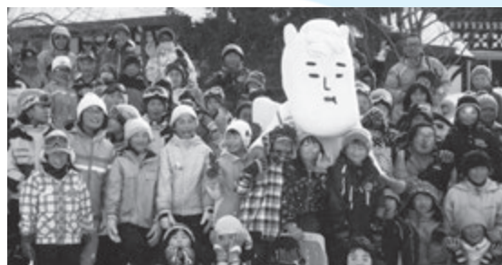
岩岳を会場に白馬北小と太地小がスキー交流を続けている。

今回、お互いの町村に訪問することで、相互理解がより深められることとなりました。姉妹都市提携を調印するにあたり、当初の目的でありました『山海交流』が、引き続き盛んに行われることを願ってやみません。これからも姉妹都市交流事業にご理解とご協力をよろしく願います。