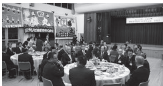
両町村合わせ約80名で行われた夕食交流会。大漁旗が掲げられ、海の町の雰囲気漂う。