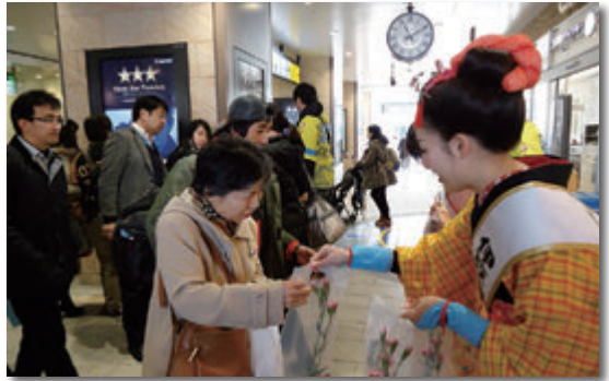
伊豆の踊り子からPRグッズを受け取る歩行者