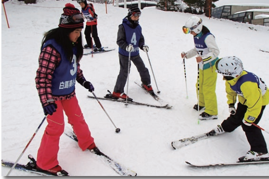
スキースキの滑り方を教えてもらう河津東小児童たち(左)