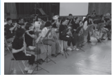
吹奏楽部は、小谷吹奏楽クラブの皆さんと合同演奏を行いました。