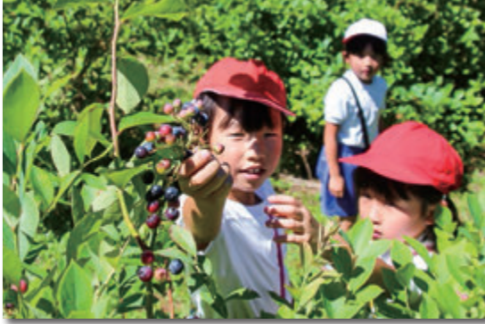
ブルーベリーを摘み取る児童