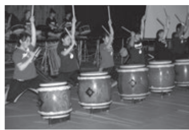
八方太鼓の勇壮な響きは、大きな感動を与えてくれました。