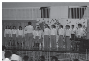
合唱コンクールでは、クラス別に美しいハーモニーを響かせました。

「第64回しろうま祭」が開催されました。7月11日（土）と7月12日（日）の2日間については、一般公開を行いました。幸い天候にも恵まれ、2日間で439名という多くの皆様に足を運んでいただきました。生徒会最大の行事として取り組まれ、地域の皆様からも大きな刺激をいただいて、達成感のある思い出深い文化祭となりました。ご理解・ご協力に感謝申し上げます。