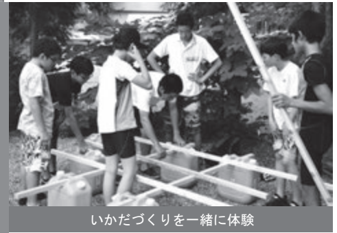
いかだづくりを一緒に体験