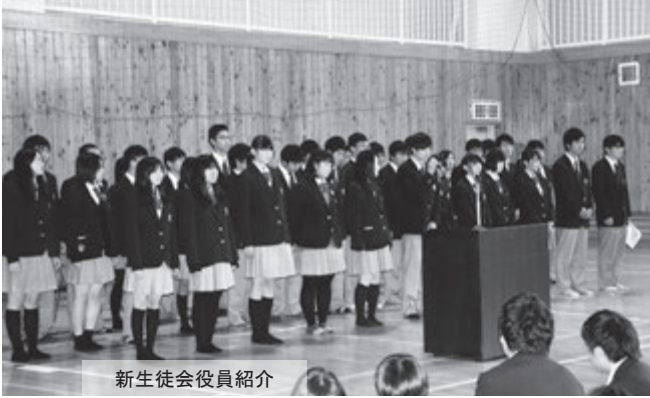
新生徒会役員紹介