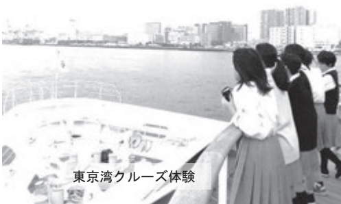
東京湾クルーズ体験

9月28日から30日まで、2年生は東京方面へ研修旅行に行っていました。1日目は明治大学駿河台キャンパスを見学し、都会の雰囲気の中、現役の大学生から学生生活について説明を受け、各自の進路について考えました。2日目はディズニーアカデミーからディズニーテーマパークの「おもてなし」について講義を受けました。観光地白馬の高校生にとって、お客様（ゲスト）に楽しんでもらうための心構え、心遣いを学ぶ機会は大変貴重なものとなりました。講義の中ではロールプレイもあり、代表の生徒がショーを演じる役者（キャスト）の立場となり、ゲストにハピネス（幸せな気持ち）を感じてもらうためにはどうすればよいか、迫真の演技で場面に応じた「おもてなし」に挑戦しました。3日目にはスカイツリーを見学し、「Cool Japan」を演出した観光施設から海外に向けた日本の姿を垣間見ました。東京方面での研修旅行は今年で最後となりますが、充実した学びの時間とすることができました。