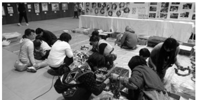
木流川と親しむ会によるリース作り