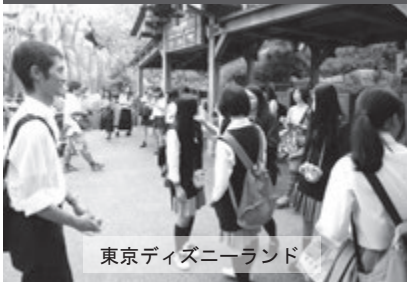
東京ディズニーランド