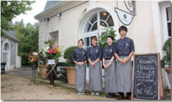
オープン初日 出迎えたOrtensiaスタッフ一同