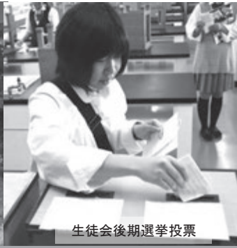
生徒会後期選挙投票