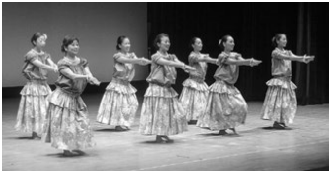
フラ ハラウ ナプア ハウオリによるフラダンス

また、姉妹都市コーナーでは静岡県河津町と和歌山県太地町の特産品の販売やふるまいがあり、大勢の方に来場していただきました。