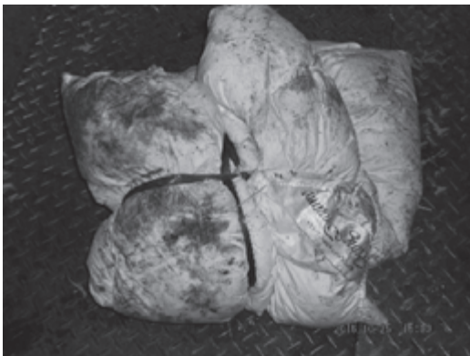
清掃センターに出された布団

最近白馬山麓清掃センターに、布団をそのままの形で持ち込まれたケースがありました。布団等大きなものをそのまま出されると、機械が故障する原因になりますので、絶対に行わないようにご協力をお願いします。(もろろん地区集積場に出すこともできません。)