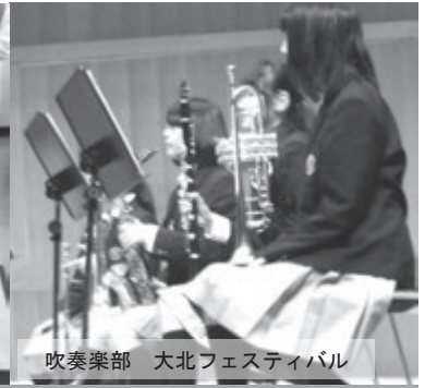
吹奏楽部 大北フェスティバル