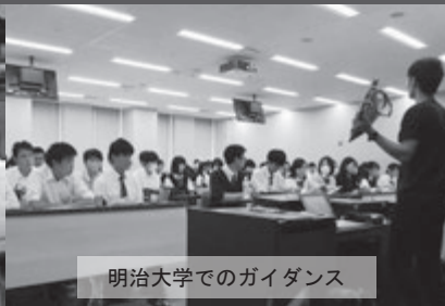
明治大学でのガイダンス