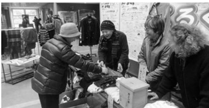
あーす隊による活動