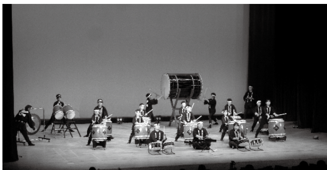
日本アルプス白馬八方太鼓保存会による演奏