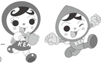
人権イメージキャラクター 人KENまもる君(右)と 人KENあゆみちゃん(左)

10月26日(木)に、人権キャラクターのまもる君とあゆみちゃんが支援ルームを訪問し、お友達と元気に踊り楽しいひと時を過ごしました。最後には子どもたち全員にマスコットがプレゼントされ、人権キャラクターを通じて人権のPRを行いました。