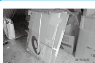
ビニールひもで縛られたダンボール

地区集積場に「ダンボール」や「新聞紙」、「雑誌・雑がみ」などの紙類のリサイクル物を縛って出すとき、写真のように、ビニールひもで縛って出されたものが見受けられます。