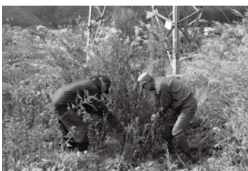
飯田自然園付近での駆除作業