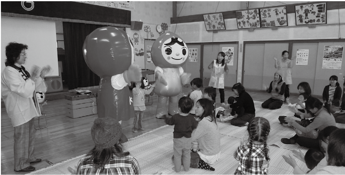
キャラクターと仲良く踊るごどもたち