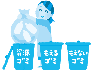
プラスチック容器包装リサイクルの実績