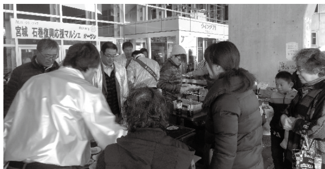
出店でにぎわう様子