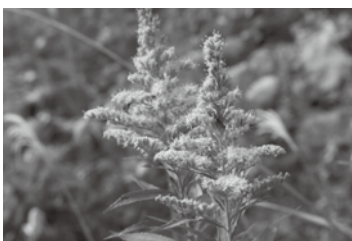
セイタカアワダチソウの花

白馬村では、長年の駆除活動の成果もあり、主要な道路から見える範囲にはセイタカアワダチソウはほとんど見えなくなりました。駆除活動にご協力・ご尽力頂いた方に大変感謝申し上げます。