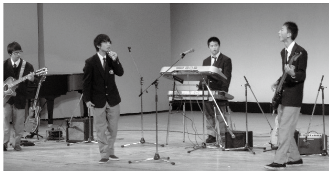
白馬高校生による音楽発表