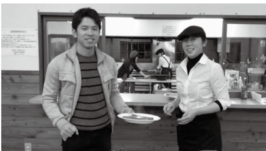
初めてガレットを作りました (Hakuba Galette Rencontre おとなのガレットづくり)

庁内では、予算査定の時期を迎えて職員の仕事も慌しくなってきました。私も、ここまで村内を回ってお聞きした話を参考にしながら、来年度から新しい施策を始めていけるよう、準備をしています。来年度予定している施策のうち、住民の皆さんに身近な話題としては、新しい図書館、地域の公共交通の見直しがあります。白馬には、どのような図書館があるべきなのか、子育て施設等、他の公共施設と一体で整備した方がよいか、現在の乗合タクシーの他にどのような交通手段が必要なのか、など、議論すべき点が多いですが、住民の方々の意見も反映しながら進められるよう、スケジュール等を検討しているところです。