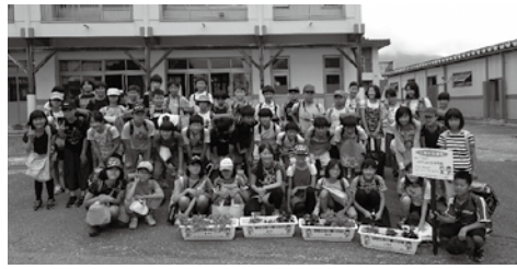
きれいに咲いた花と記念撮影(北小学校)

6月から10月にかけて、白馬南・北小学校の全児童が人権の花運動に取り組みました。 この事業は愛情・関心を持って花に接することでもどんな命でもあることを学び人権尊重を理解することを行われま