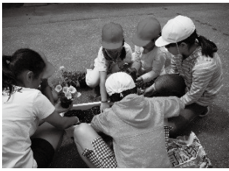
移植風景(南小学校)