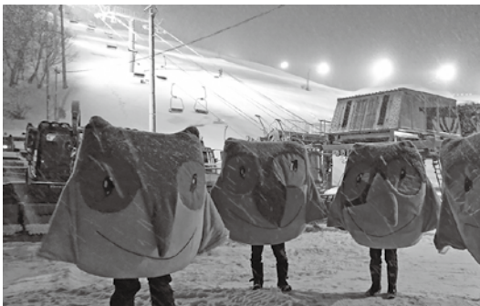
八方火祭りに現れたスノーレッツ

また、2月は中学校、小学校、幼稚園をそれぞれ訪問して、児童・生徒・子ども達の様子を見させていただきました。小学校の参観では、インターネットやスマホ利用についての授業や英語に触れる授業がある一方、演劇をやっているクラスがあるなど、私が小学校のときの授業とは全く違って、自分が確実にオヤジ化しているのを実感しました。世の中の流れについていかないと(汗)。小中学校ではともに、地元のボランティアの方々の力をお借りした活動を行っております。先生だけではできない授業を提供して頂いて大変好評のようで、ありがたい限りです。中学校の数学のボランティア指導員が不足していると聞いたので、私も登録しようか考え中です。ちなみに、先日ひよんなことから、白馬の民宿に初めて泊ってもらいました。民宿は、昔、家族旅行で泊まって