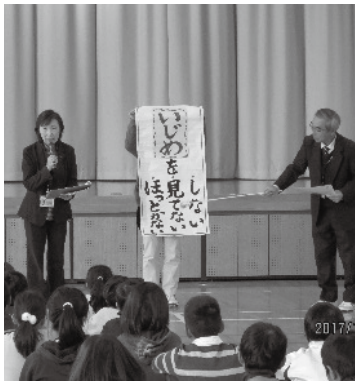
人権教室での呼びかけ

びかけをし、委員の呼びかけに続き全児童も大きな声で呼びかけを行いました。 人権教室では友達の誕生日会でのプレゼントをきっかけに起こった仲間外れを題材としたDVDを観て自分が登場人物だったかどうかなどの委員からの問いかけに児童たちは、自分の気持ちや感じたことを素直に伝え、委員からの人を思いやり友達と仲良くしようの言葉に元気に返事をしていました。