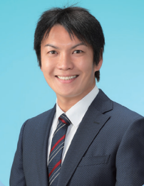
Mayor of Hakuba Village