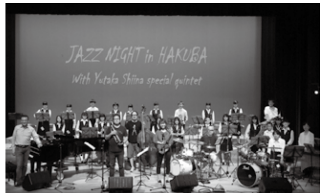
椎名豊 ジャズコンサート