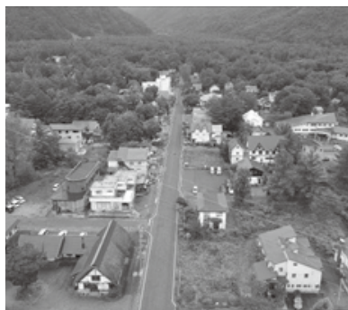
ドローンによる空撮調査