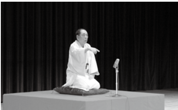
ウイング七夕寄席