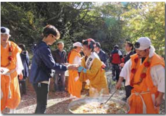
猪鍋を振る舞う伊豆の踊り子