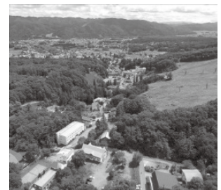
スキーリゾートエリア