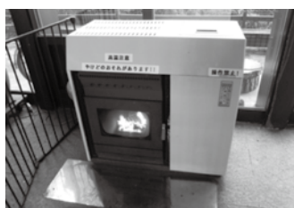
ペレットストーブ (白馬村役場)

ペレットストーブは、木質ペレットを燃料とするストーブです。間伐材などの未利用の森林資源を燃料とするため、森林保全、地球温暖化対策などに繋がるストーブとして注目を集めています。