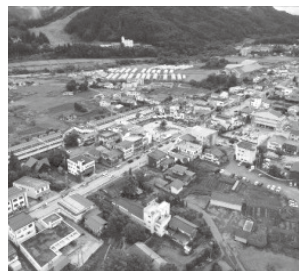
市街地・ロードサイドエリア