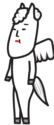
白馬村キャラクター ヴィクトワール・シュヴァルブラン・村男Ⅲ世